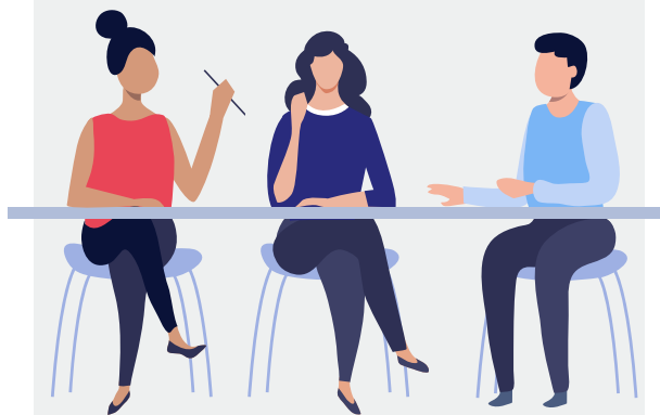
Presidente - Secretario - Vocal

Estos estudiantes serán designados a través de un sorteo en un plazo no superior a 5 días antes del día de la votación, y de diferentes niveles para asegurar la participación equitativa de todos los cursos.